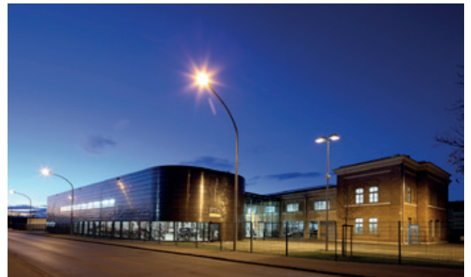
Restaurant Lessing's Lessingstr. 5 (in der Oldtimerfabrik Classic) 89231 Neu-Ulm www.lessings-nu.de